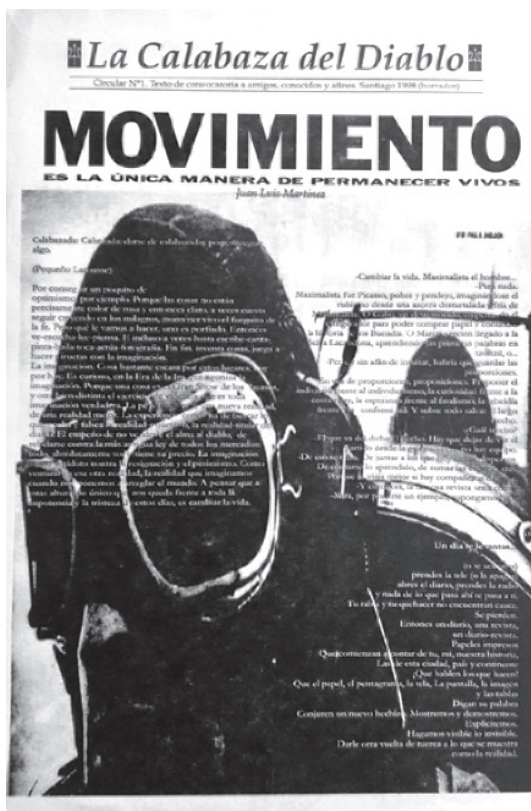
Imagen 2. Borrador de la primera circular (Santiago, 1998) destinada a convocar a amigos, conocidos y afines a participar de la revista.

Llama la atención la referencia a La Nueva Novela de Juan Luis Martínez, quien también aparece con su nombre tachado igual que en su libro. Este gesto ya remite a una experiencia editorial donde se borra al autor a favor de un colectivo.